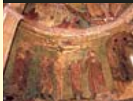
Gazeoko San Martin

6 GAZEOKO SAN MARTIN ELIZA. Bertako absidea eta presbiterioa erlijio-eszenak irudikatzen dituzten pintura gotikoek estaltzen dituzte guztiz.